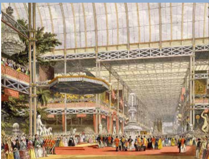
© Crystal Palace - Joseph Paxton