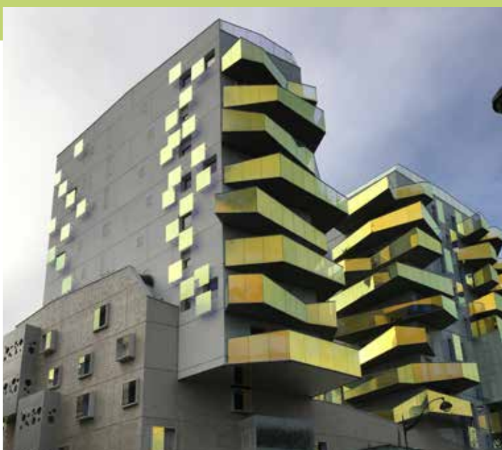
Copropriété quai d'Austerlitz